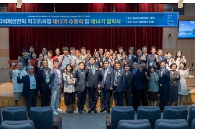
수료식 및 입학식