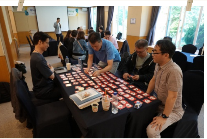
KAIST-AIP Workshop II