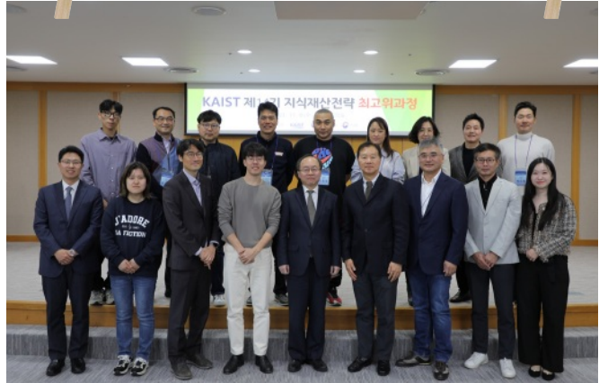
특허법원 견학 I