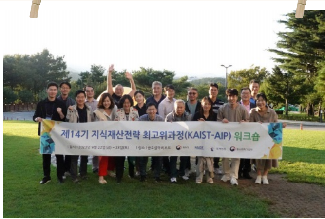
KAIST-AIP Workshop I