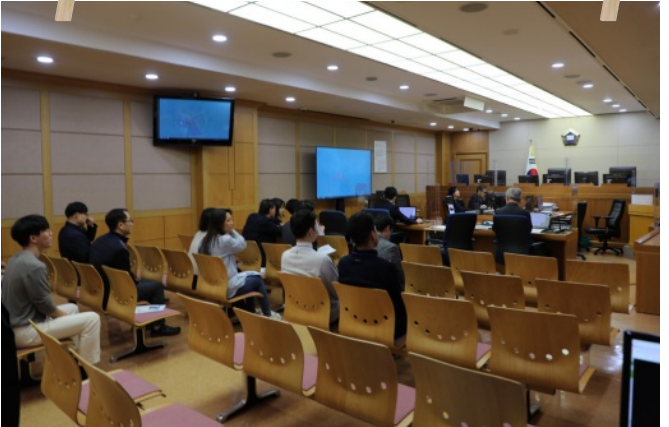
특허법원 견학 II