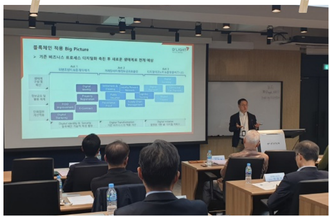
KAIST-AIP Open Class